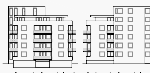
Západní pohled Východní pohled

OZNAČENÍ: A-3.04 PODLAŽÍ: 3. NP ORIENTACE: SZ PLOCHA BYTU: 47,44 m 2 PLOCHA BALKONU: - TYP: atelier 1+kk MĚŘÍTKO: M 1:100