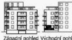
Západní pohled Východní pohled