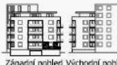
Západní pohled Východní pohled